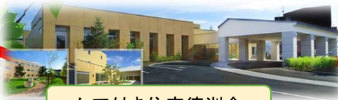
ケア付き住宅徳洲会